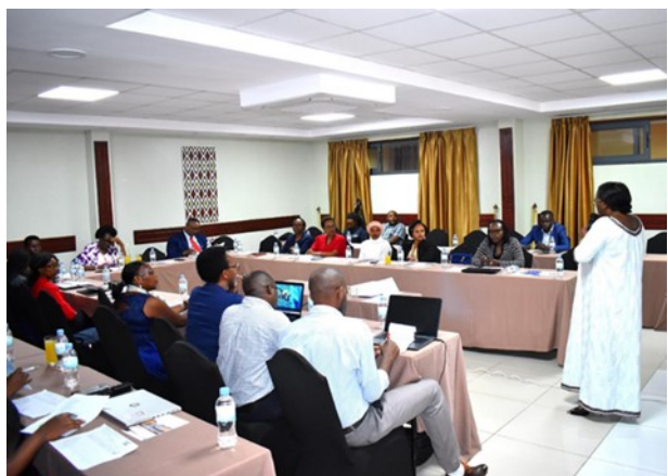
Activité de plaidoyer auprès des membres de la commission sociale (parlement du Rwanda), mars 24

En plus des activités de sensibilisation communautaire qui ont touché plus de 50 441 personnes depuis le début du projet (60% femmes et jeunes filles majoritairement de 10 à 24 ans), il y a eu l'acquisition de l'accréditation provisoire pour l'ouverture d'une clinique spécialisée en SDSR (févr. 2024) qui permettra de continuer à offrir les services de counseling psychosocial (disponible depuis janvier 2023) et de rendre disponibles et accessibles des soins médicaux en lien avec la SDSR tels que la contraception, les grossesses, les traitements contre les ISF - VIH/SIDA, la prise en charge des victimes des violences basées sur le genre, etc.