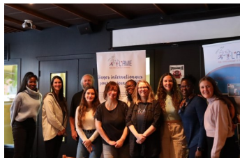
Équipe de L'AMIE et les anciennes stagiaires du programme

Le samedi 28 janvier dernier, ce fut l'événement de clôture du Programme de stages internationaux pour les jeunes (PSIJ) couvrant la période de 2018 à 2022.