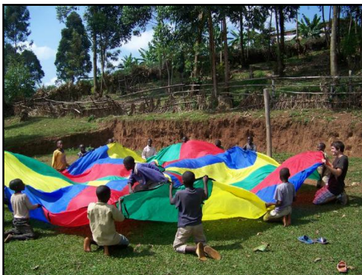
Le conseiller en intervention sportive avec les enfants de L'OPDE

Le Wiñay accueillait sa première stagiaire individuelle, une conseillère en intervention pédagogique , afin que celle-ci puisse renforcer les capacités pédagogiques des jeunes volontaires qui fréquentent les centres Wiñay. L'objectif était d'assurer un meilleur encadrement des enfants en difficultés d'apprentissage et en perte de motivation pour leurs études.