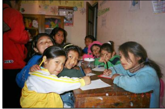
Le Wiñay en Bolivie