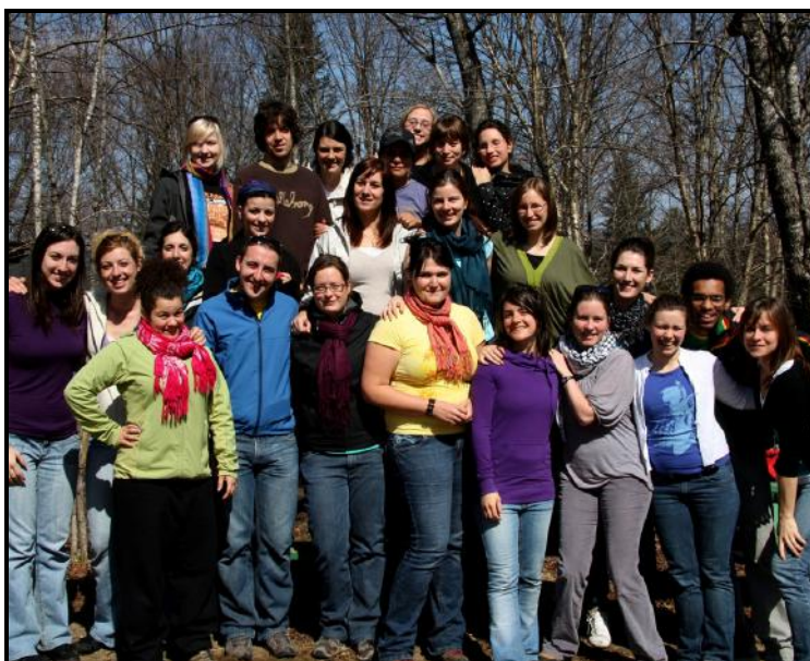
Cohorte 2008-2009 Québec sans Frontières

Grâce à une subvention salariale octroyée par le gouvernement dans le cadre du programme Québec sans frontières, L'AMIE engage chaque année un/e adjoint/e aux stages. Ce poste a été occupé successivement par deux personnes. Cet appui dans l'encadrement des stages est nécessaire pour le bon déroulement et le bon fonctionnement du programme QSF. Il permet aussi aux stagiaires d'acquérir de nouvelles compétences dans le monde de la coopération internationale.