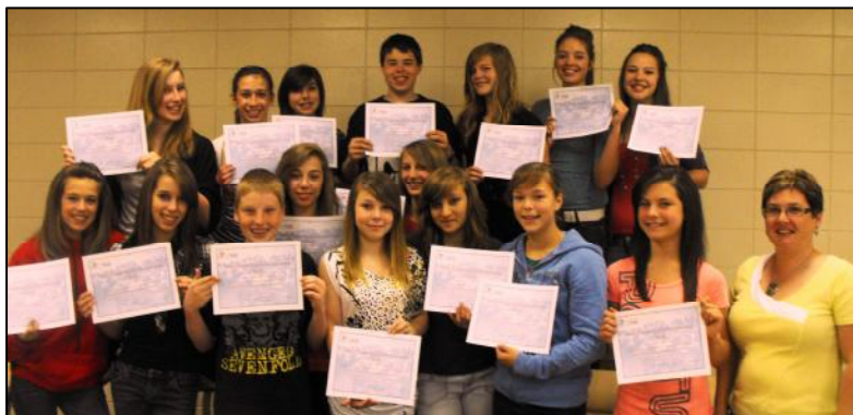
Les jeunes du groupe S.O.S Haïti de l'école l'Envol de St-Nicolas

Plusieurs approches auprès d'écoles ont été faites afin de leur présenter le jumelage inter-écoles. Deux nouveaux jumelages inter-écoles ont été créés à la suite de ces approches. L'un de ces jumelages viendra en aide à une école en Haïti tandis que l'autre fut jumelé à une école au Madagascar. Leurs activités de financement se feront au cours du printemps 2010.