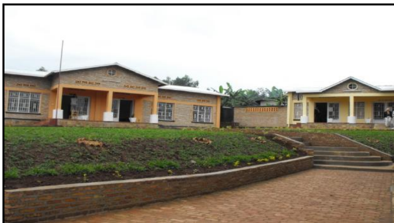
Les batiments du Centre de formation professionnelle de l'OPDE Rwanda