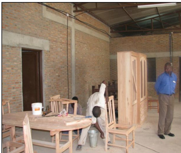
L'atelier de menuiserie de l'OPDE Burundi

Les quatre ateliers de production ont été mis en place en 2008 soit couture, menuiserie, coiffure et mécanique. L'atelier mécanique a été loué à un entrepreneur privé, ce qui permet une entrée d'argent permanente. Les jeunes ayant suivi la formation au centre professionnel continuent de réaliser des stages dans ces ateliers.