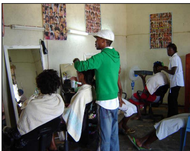
L'atelier de coiffure de l'OPDE Burundi