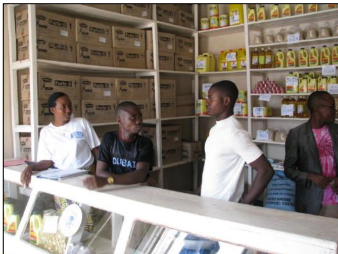
Le comptoir alimentaire de L'OPDE Congo

En 2009, des suivis mensuels ont été élaborés pour permettre à l'OPDE-Congo de mesurer les rendements du moulin à grain et du comptoir alimentaire. Dans l'ensemble, on remarque que les ventes progressent et plusieurs jeunes y ont fait leur stage.