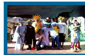
Le groupe de théâtre au Winay